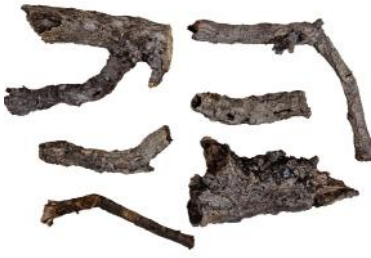
40440 VE 5 1Kg Korkaststücke Mix ca. Ø 0,5-4 x 5-20cm