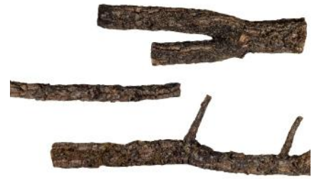
50520 VE 1 10Kg Korkaststücke Mix ca. Ø 2-6 x 25-70cm