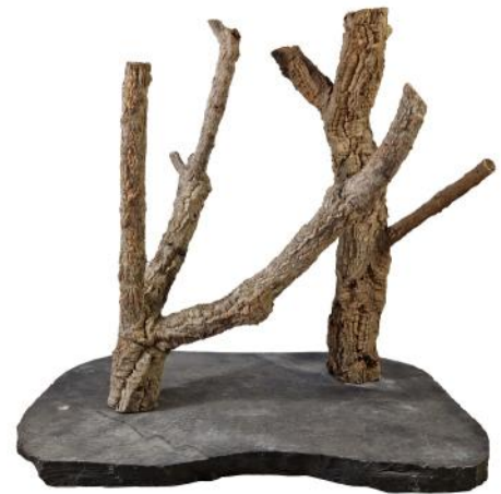
51421 VE 1 Holzskulptur Kork Gr. M ca. 50 x 35 x 40-50cm