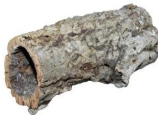
50512 VE 6 | 24 Korkröhre Gr. M ca. Ø 15-20 x 30-55cm