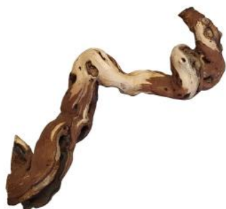
20060 VE 10 Weinreben-Ast Gr. M ca. 20-30cm