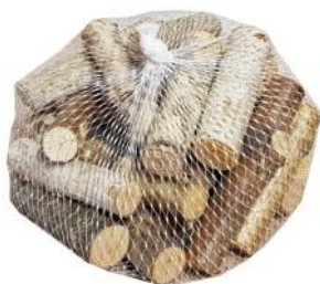
40431 VE 12 Pack Birkenstößchen ca. Ø 1-2 x 6-9cm lang