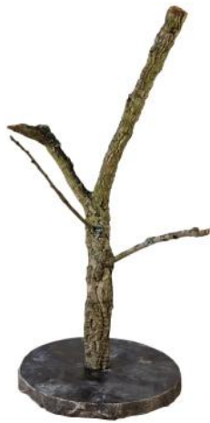
51420 VE 1 Holzskulptur Kork Gr. S ca. Ø 30 x 50-55cm hoch