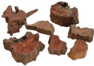
10192 VE 25 Wurzelscheibe Gr. S 4-10cm Durchmesser ca. 2-3cm Stärke

Ca. 3cm stark, ideal zur Deko oder Unterlage.