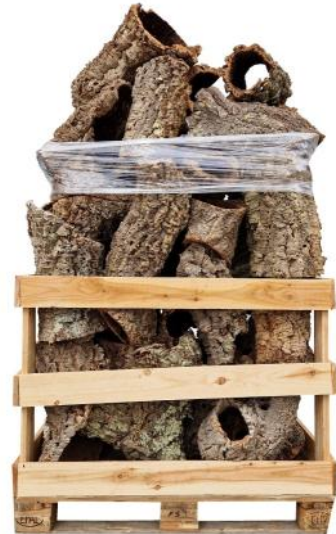
50385 VE 1 Palette Korkröhren im Mix per Kg ca. Ø 20-40 x 20-60cm