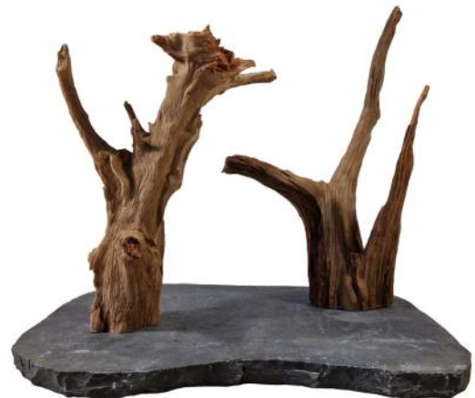
51411 VE 1 Holzskulptur Wurzel Gr. M ca. 50 x 35 x 40-50cm hoch