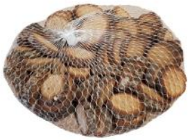
40435 VE 8 500g Pack Eiche rund 2-5cm Durchmesser ca. 0,8cm Stärke