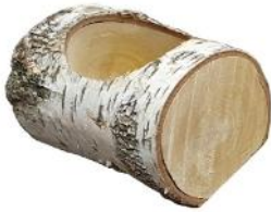
51102 VE 1 Holztrog kurz ca. 13 x 13 x 10cm Bohrung ca. Ø 10cm

Zur Dekoration von Terrassen, Eingangsbereichen und Indoor.