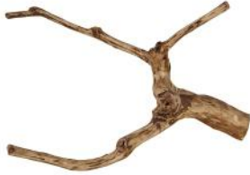
50240 VE 1 Teebaum Holz Gr. S ca. 20-35cm