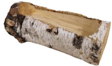
51105 VE 1 Holztrog XXL ca. 40 x 15-18 x 12cm Bohrung ca. 10x35cm

Hinweis: Aus Stammholz gefertigt! Auch als Pflanzschale geeignet. Lieferung jedoch ohne Folie!