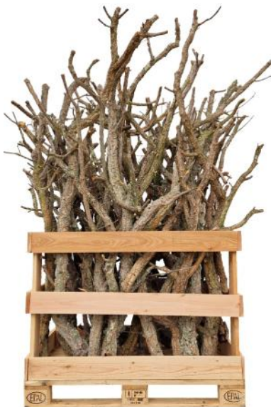
50383 VE 1 Palette Korkäste im Mix per Kg ca. Ø 2-10 x 50-200cm

Abrechnung erfolgt per Kg. Es wird nur das Nettogewicht ohne Palette/Verpackung berechnet!