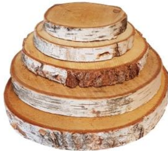
40013 VE 24 Scheiben rund 14-17cm Durchmesser ca. 2cm Stärke