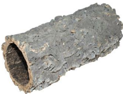
50514 VE 1 Korkröhre Gr. XL ca. Ø 20-30 x 55-80cm