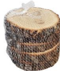
40041 VE 10 5er Pack Eiche rund 10-13cm Durchmesser ca. 2cm Stärke