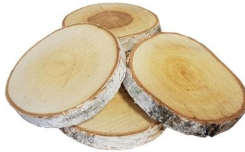
40015 VE 16 Scheiben rund 18-22cm Durchmesser ca. 2cm Stärke