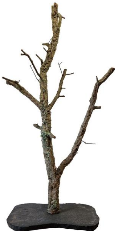
51440 VE 1 Kleiner Naturbaum aus Korkeiche ca. 40-60cm breit ca. 100-120cm hoch