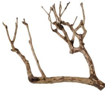
50241 VE 1 Teebaum Holz Gr. M ca. 35-50cm