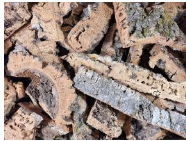
50539 VE 1 Schredderbox 1,5-2Kg ca. 5-20cm