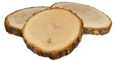
40043 VE 16 Eichenscheiben rund 18-22cm Durchmesser ca. 2cm Stärke