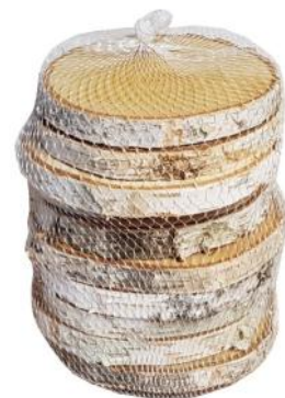
40002 VE 12 10er Pack rund 8-12cm Durchmesser ca. 0,8cm Stärke