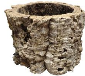
50519 VE 6 Korkring ca. Ø 20-25 x 15cm