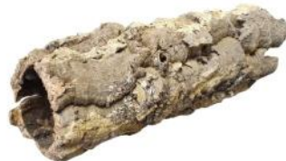
50511 VE 8 Korkröhre Gr. S ca. Ø 10-15 x 20-40cm