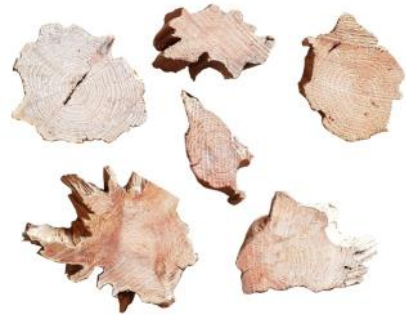
10201 VE 25 Wurzelscheibe Gr. M 10-20cm Durchmesser ca. 2-3cm Stärke