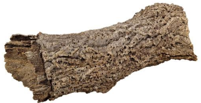
50515 VE 1 Korkröhre Gr. XXL ca. Ø 30-40 x 60-100cm