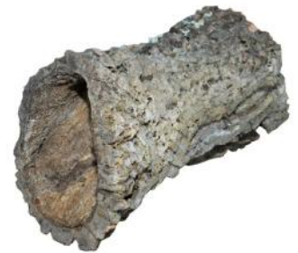
50513 VE 1 Korkröhre Gr. L ca. Ø 20-30 x 30-55cm