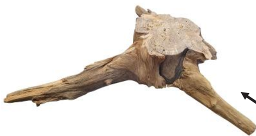
10330 VE 1 Wurzelscheibe extra dick L 26-29cm Durchmesser ca. 5-6cm Stärke