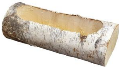
51103 VE 1 Holztrog lang ca. 30 x 13 x 10cm Bohrung ca. 7x25cm