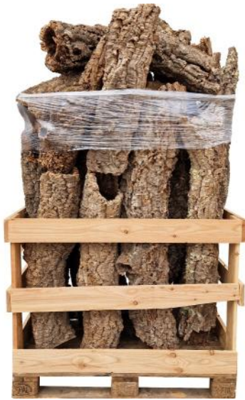
50381 VE 1 Palette Korkröhren im Mix per Kg ca. Ø 5-25 x 20-150cm

Vorteil für Dekorateure/Floristen: Individuellere Verwendungsmöglichkeiten für Ihre Projekte!