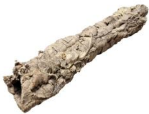
50510 VE 10 | 40 Korkröhre Gr. XS ca. Ø 5-10 x 20-40cm

Kork eignet sich hervorragend zur Gartengestaltung, da das Material witterungsbeständig ist. Ideal zur Bepflanzung oder als Schaustück zur Dekoration. Vielseitig und kreativ einsetzbar. Die Naturkorkrinde zersetzt sich nicht wie bei handelsüblichen Hölzern.