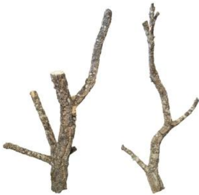
50525 VE 10 | 40 Korkäste/Korktronchos ca. Ø 2-8 x 55-75cm