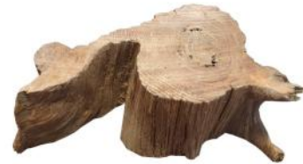
10320 VE 1 Wurzelscheibe extra dick M 20-25cm Durchmesser ca. 5-6cm Stärke