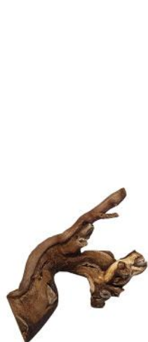
20030 VE 12 Weinreben-Ast Gr. S ca. 10-20cm

Weinreben-Ast = Einfach gewachsene Stücke (Ø 2-7cm) ohne besondere Verzweigung / Astzweigen