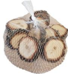
40040 VE 12 10er Pack Eiche rund 4-8cm Durchmesser ca. 2cm Stärke