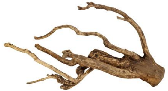
50242 VE 1 Teebaum Holz Gr. L ca. 50-80cm