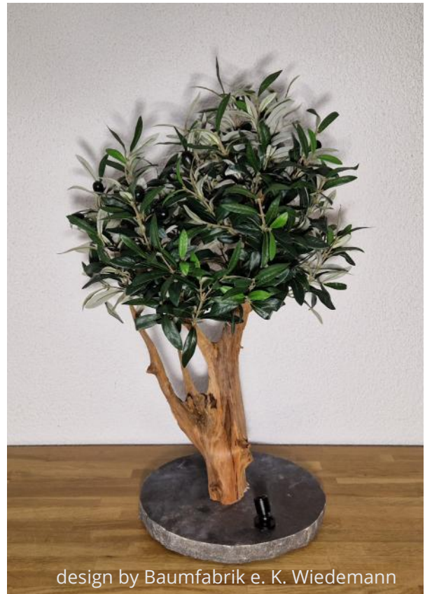
design by Baumfabrik e. K. Wiedemann

Weitere Ausführungen finden Sie auf Seite 11,15,24 & 25.