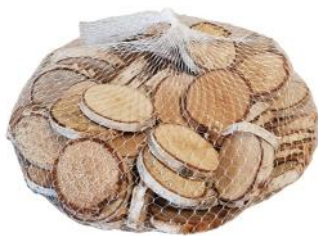
40434 VE 8 500g Pack rund 2-5cm Durchmesser ca. 0,8cm Stärke