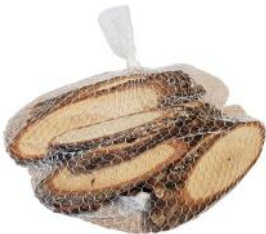
40005 VE 8 15er Pack Eiche oval 10-15 lang / 3-6cm breit ca. 0,8cm Stärke