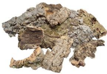
50536 VE 50 Korkstücke im Mix ca. Ø 5-15cm