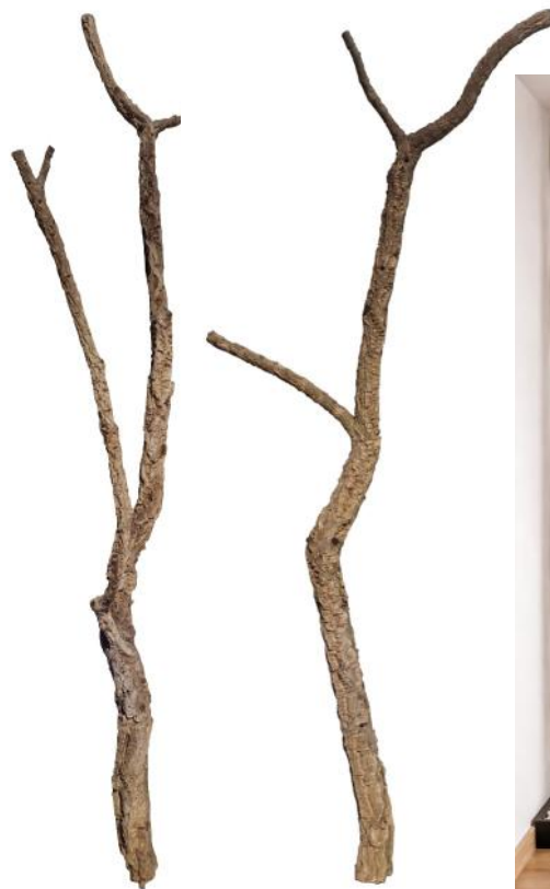
50528 VE 1 Korkäste/Korktronchos ca. Ø 2-10 x 150-200cm