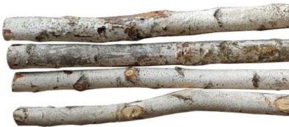
40159 VE 5 Birkenstange ca. Ø 6-10 x 200cm lang