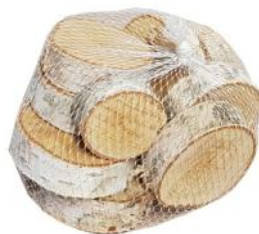
40001 VE 12 10er Pack rund 4-8cm Durchmesser ca. 2cm Stärke