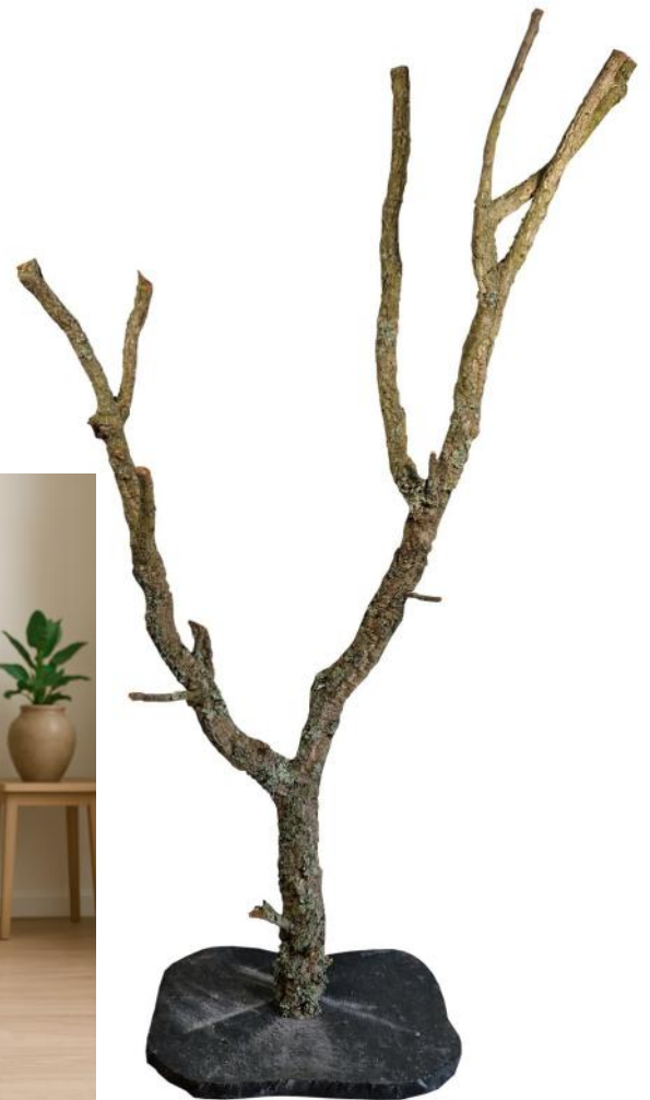
51441 VE 1 Großer Naturbaum aus Korkeiche ca. 60-80cm breit ca. 130-150cm hoch

Tipp: Steinplatte lässt sich gut mit Wasser reinigen!