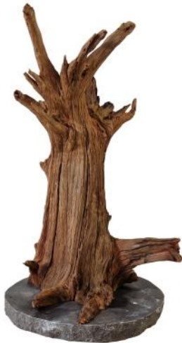
51410 VE 1 Holzskulptur Wurzel Gr. S ca. Ø 30 x 40-50cm hoch