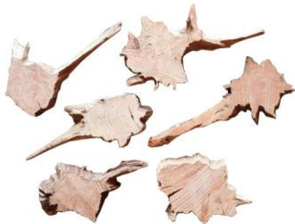
10231 VE 20 Wurzelscheibe Gr. L 20-30cm Durchmesser ca. 2-3cm Stärke