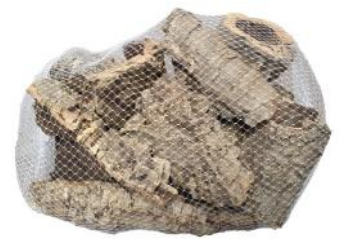
50532 VE 8 500g Korkbruch ca. Ø 5-15cm