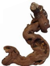
20080 VE 8 Weinreben-Ast Gr. L ca. 30-40cm