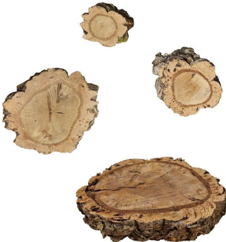
50523 VE 5 Korkastscheibe Gr. S 5-10cm Durchmesser ca. 2-3cm Stärke