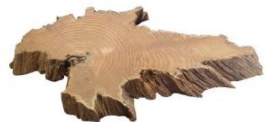
10280 VE 1 Wurzelscheibe Gr. XXL 40-55cm Durchmesser ca. 2-3cm Stärke