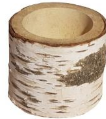
51104 VE 1 Holztrog rund ca. Ø 13 x 10cm Bohrung ca. Ø 8cm