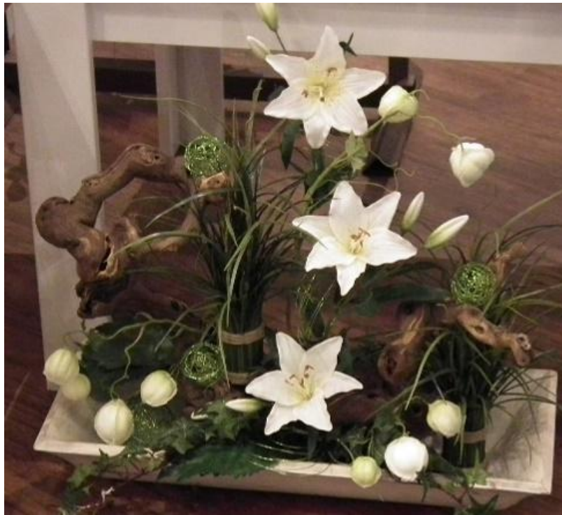
Weinreben-Kopf = Kompakt gewachsene Stücke mit starken Verzweigungen und vielen Astzweigen