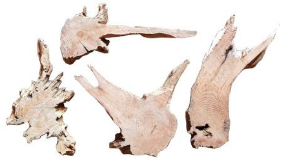
10261 VE 12 Wurzelscheibe Gr. XL 30-40cm Durchmesser ca. 2-3cm Stärke