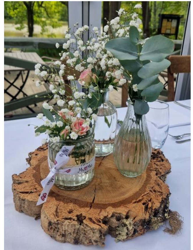
Hinweis: Artikel 50526 Gr. XXL