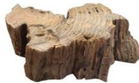
10310 VE 1 Wurzelscheibe extra dick S 13-19cm Durchmesser ca. 5-6cm Stärke