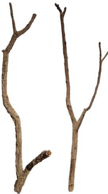
50527 VE 1 Korkäste/Korktronchos ca. Ø 2-10 x 100-140cm