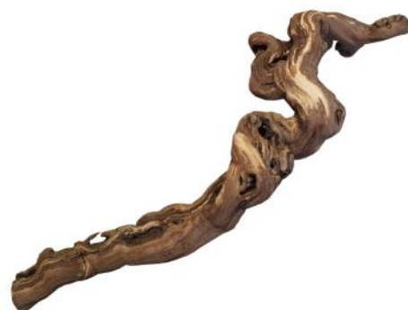
20090 VE 8 Weinreben-Ast Gr. XL ca. 30-40cm