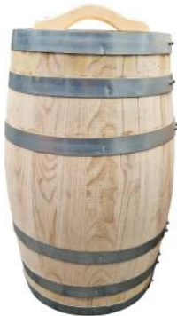
31552 VE 1|18 Regentonne aus Kastanie 50 Liter Ø ca. 40 | H 60cm