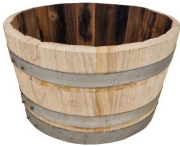
30260 VE 1|48 Blumenkübel Kastanie „S“ Ø ca. 38-42 | H 24-26cm