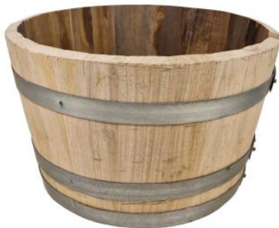
30261 VE 1|24 Blumenkübel Kastanie „M“ Ø ca. 48-50 | H 28-30cm

Aus Kastanie hergestellte Blumenkübel eignen sich als: Wasserteich | Kräuterbeet | Pflanzkübel