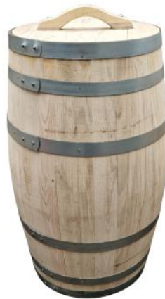
31553 VE 1|6 Regentonne aus Kastanie 100 Liter Ø ca. 48 | H 78cm