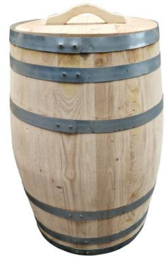
31554 VE 1|4 Regentonne aus Kastanie 150 Liter Ø ca. 56 | H 80cm