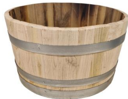
30262 VE 1|16 Blumenkübel Kastanie „L“ Ø ca. 58-60 | H 32-34cm