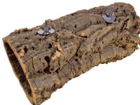
51207 VE 1 Kork-Höhle Medium ca. Ø 15-19 x 35cm „40mm Scheibe“