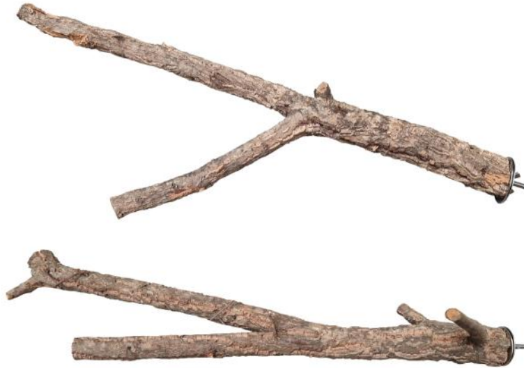
82061 VE 1 Kork-Sitzast ca. Ø 2-8 x 55-75cm lang „55mm Scheibe“