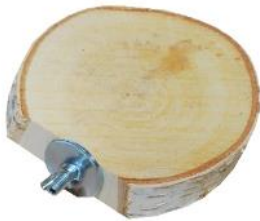
51161 VE 1 Birkenscheibe rund ca. Ø 12-15cm „40mm Scheibe“