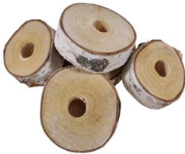
51352 VE 1 5er Pack Birkenscheiben ca. Ø 4-8cm