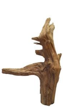
10380 VE 1 Wurzelspitze geschnitten Klein | ca. 20 - 30cm

Kiefern-/Fichtenstücke mit bis zu mit 1er Schnittkante zum Ankleben/Schrauben!