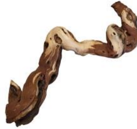
20080 VE 8 Weinreben-Ast Gr. L ca. 30 - 40cm