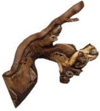
20030 VE 12 Weinreben-Ast Gr. S ca. 10 - 20cm