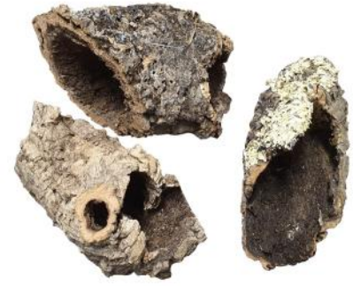
50538 VE 15 Korkröhren-Endstücke L ca. Ø 10-20 x 15-25cm