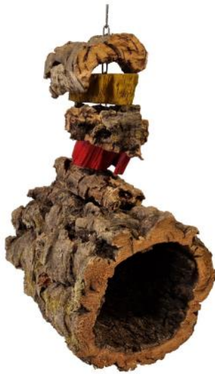
51320 VE 1 Korkhöhle mit Spielzeug ca. 20 breit / 35cm hoch