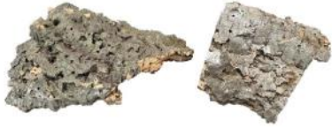
50504 VE 15 Korkplatte Gr. XS ca. 10-15 x 15-20cm

Zur individuellen Gestaltung als Schaukel oder Sitzplatz!