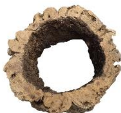
50519 VE 6 Korkring ca. Ø 20-25 x 15cm

Kann zu einer erhöhten Futterstelle im Bodenbereich umfunktioniert werden.