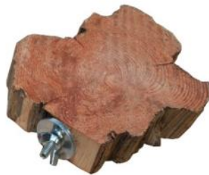
51160 VE 1 Wurzelscheibe ca. Ø 15-20cm „40mm Scheibe“