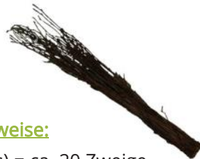
40133 VE 1 Bund Birkenzweige kurz ca. 40-50cm lang