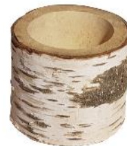
51104 VE 1 Holztrog rund ca. Ø 13 x 10cm Bohrung ca. Ø 8cm