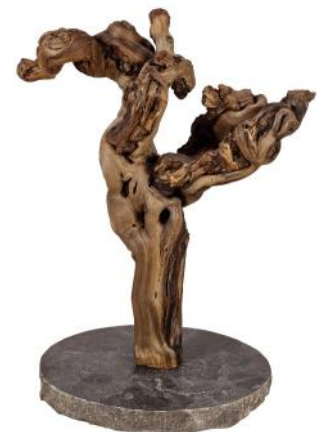
51414 VE 1 Holzskulptur Weinrebe ca. Ø 30 x 35-50cm hoch