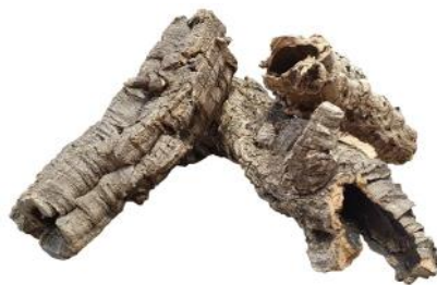
50537 VE 20 Korkröhren-Endstücke M ca. Ø 5-10 x 10-20cm