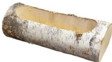
51103 VE 1 Holztrog lang ca. 30 x 13 x 10cm Bohrung ca. 7x25cm