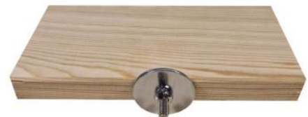
51172 VE 1 Lärchensitzbrett ca. 9x18cm „40mm Scheibe“