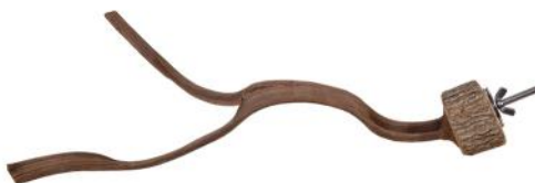
82040 VE 1 Y-Sitzstange Liane ca. Ø 2-4 x 30cm lang „30mm Scheibe“