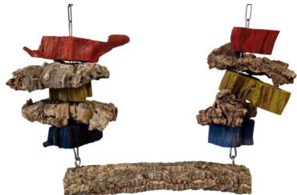
51340 VE 1 Spielzeug-Schaukel ca. 30 breit / 25cm hoch