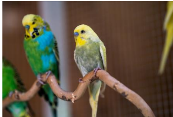
82018 VE 1 Birken-Sitzstange Groß ca. Ø 1-3 x 40cm lang „40mm Scheibe“