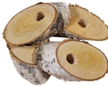
51353 VE 1 5er Pack Birkenscheiben ca. 9-13cm lang