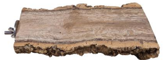
51175 VE 1 Korkastsitzbrett ca. Ø 5-10cm | 20cm lang „40mm Scheibe“