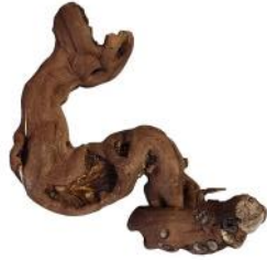
20060 VE 10 Weinreben-Ast Gr. M ca. 20 - 30cm