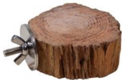
51173 VE 1 Wurzelscheibe mini ca. Ø 8-12cm „40mm Scheibe“