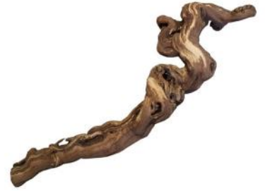
20090 VE 8 Weinreben-Ast Gr. XL ca. 40 - 50cm