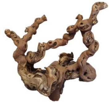
20240 VE 4 Weinreben-Kopf Gr. M ca. 40 - 50cm