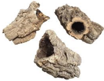
50535 VE 20 Korkröhren-Endstücke S ca. Ø 5-10 x 5-10cm