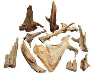
10520 VE 1 Wurzel-Endstücke/-bruch 1Kg | ca. 5 - 20cm