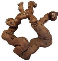
20190 VE 6 Weinreben-Kopf Gr. XS ca. 20 - 30cm