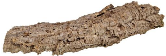
50502 VE 1 Korkplatte Gr. L ca. 20-40 x 60-80cm