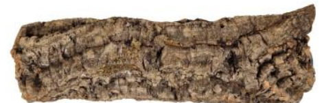
82021 VE 1 Kork-Sitzstange Large ca. Ø 6-8 x 30cm lang „55mm Scheibe“