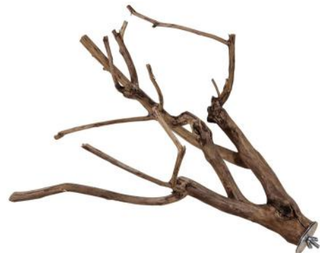
82064 VE 1 Teebaum Sitzast Groß ca. 35-50cm „55mm Scheibe“