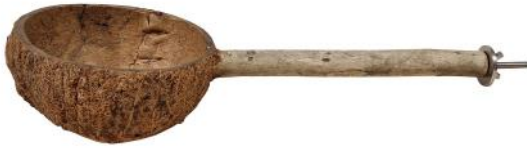
82030 VE 1 Futterschale mit Stiel ca. Ø 13 x 30cm „30mm Scheibe“