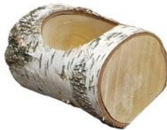
51102 VE 1 Holztrog kurz ca. 13 x 13 x 10cm Bohrung ca. Ø 10cm