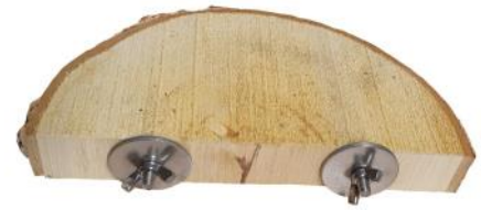
51167 VE 1 Birkenscheibe halbiert ca. 10-12 x 20-25cm „40mm Scheibe“