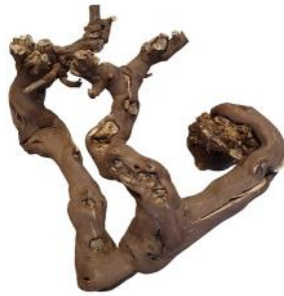
20220 VE 6 Weinreben-Kopf Gr. S ca. 30 - 40cm