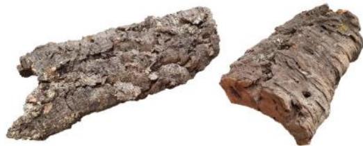
50501 VE 10 | 50 Korkplatte Gr. M ca. 10-25 x 30-55cm