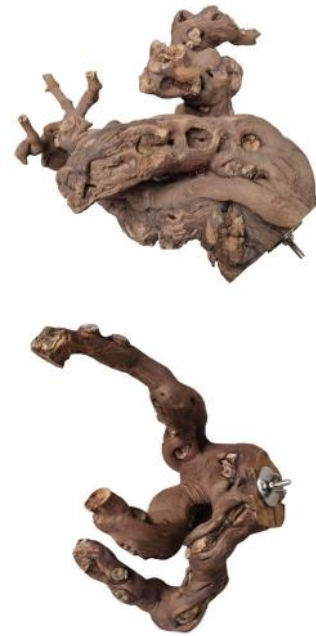
82062 VE 1 Weinreben-Sitzast ca. Ø 20-30cm „55mm Scheibe“