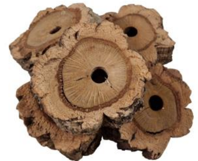
51354 VE 1 5er Pack Korkscheiben ca. Ø 5-9cm