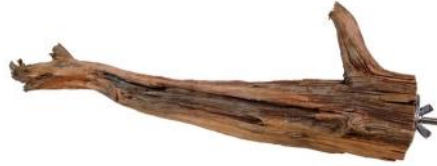
82060 VE 1 Wurzel-Sitzstange Groß ca. Ø 2-10 x 30-40cm lang „55mm Scheibe“