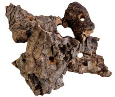
51351 VE 1 5er Pack Korkstücke ca. Ø 6-12cm