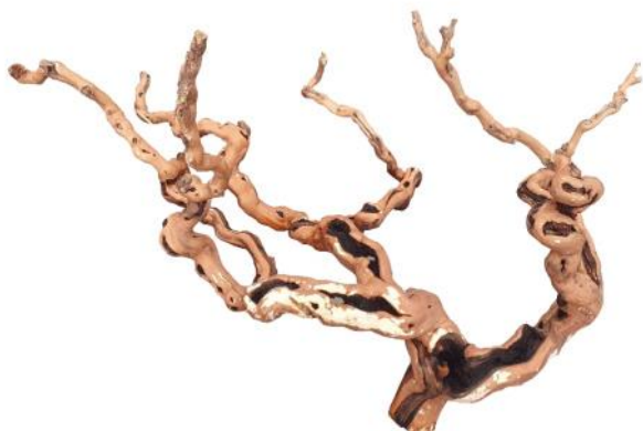
20280 VE 1 Weinreben-Kopf Jumbo ca. 85 - 120cm