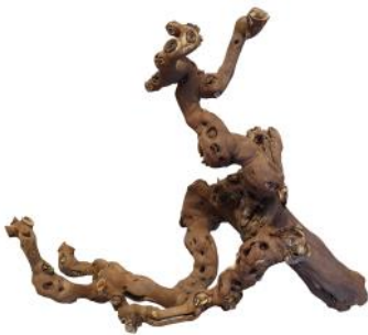
20250 VE 1 Weinreben-Kopf Gr. L ca. 50 - 60cm