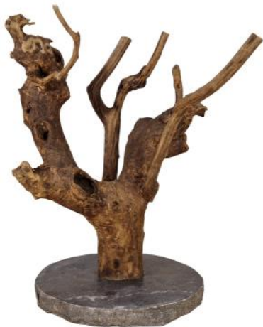
51412 VE 1 Holzskulptur Teebaum ca. Ø 30 x 35-50cm hoch

Diese dienen zum Schutz von sensiblen Oberflächen. Je nach Raumklima, können diese Verrutschen. Eine regelmäßige Sichtkontrolle wird daher empfohlen.