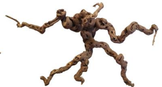
20270 VE 1 Weinreben-Kopf Gr. XXL ca. 70 - 80cm