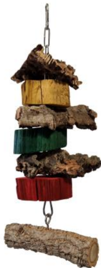
51330 VE 1 Spielzeug mit Korkkast ca. 15 breit / 30cm hoch

Die eingefärbten Holzscheiben fördern den Spieltrieb von Vögeln. Dadurch werden die Korkstücke besser zur Schnabelpflege genutzt (schreddern).