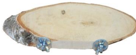
51162 VE 1 Birkenscheibe oval ca. 8-12 x 23-28cm „40mm Scheibe“