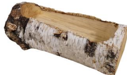
51105 VE 1 Holztrog XXL ca. 40 x 15-18 x 12cm Bohrung ca. 10x35cm