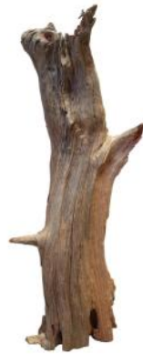
10390 VE 1 Wurzelspitze geschnitten Groß | ca. 30 - 40cm