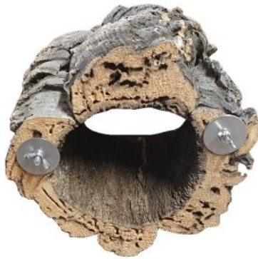
51200 VE 1 Kork-Ring 2x Halterung ca. Ø 20-25 x 15cm „40mm Scheibe“