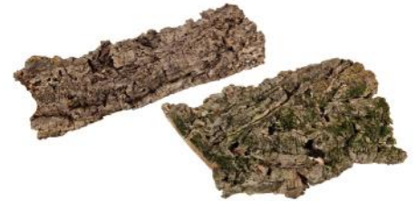
50500 VE 10 Korkplatte Gr. S ca. 10-20 x 25-40cm