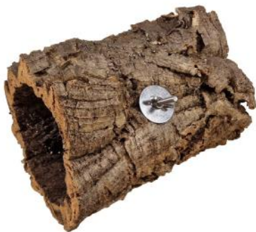
51206 VE 1 Kork-Höhle Small ca. Ø 15-19 x 20cm „40mm Scheibe“

Do-It-Yourself: Korkringe/-röhren (Seite 31-32)