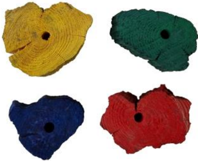
51350 VE 1 4er Pack Wurzelscheiben ca. Ø 4-10cm