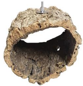
51201 VE 1 Kork-Ring 1x Halterung ca. Ø 20-25 x 15cm „40mm Scheibe“