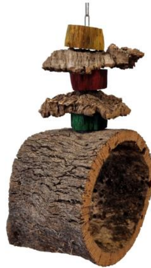
51321 VE 1 Korkring mit Spielzeug ca. 25 breit / 40cm hoch