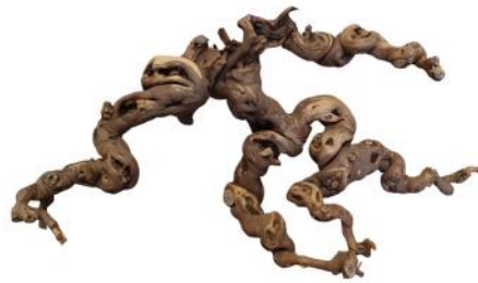
20260 VE 1 Weinreben-Kopf Gr. XL ca. 60 - 70cm