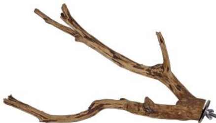
82063 VE 1 Teebaum Sitzast Klein ca. 20-30cm „40mm Scheibe“