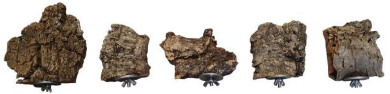
51168 VE 1 Sitzbrett „Korkbruch“ ca. Ø 6-12cm „40mm Scheibe“