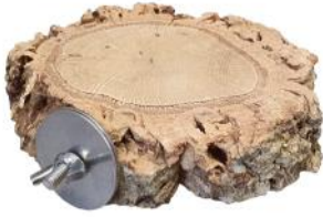
51169 VE 1 Korkastscheibensitzbrett ca. Ø 9-15cm „40mm Scheibe“