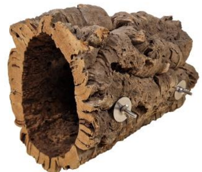
51208 VE 1 Kork-Höhle Large ca. Ø 22-28 x 30cm „55mm Scheibe“