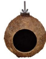
82032 VE 1 Kokosnuss Nest ca. Ø 10-13cm Eingang ca. Ø 6cm „30mm Scheibe“